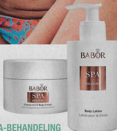
Shaping Vitamin ACE Body Cream van Babor Spa € 42,90 www.babor.be

De contour- en shapebehandeling met producten van Babor duurt een uur en een kwartier en kost € 120 euro, wij gingen testen bij 't Zenhuys in Kontich - www.zenhuys.be ●